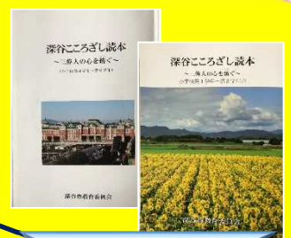
深谷こころざし読本