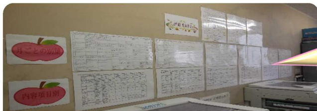
別葉、指導計画を目につく印刷室へ掲示

全職員に重点項目や各教科等における指導の内容及び時期を明確に(見える化)することにより、各教科等において意図的、計画的な道徳教育を実践できる。