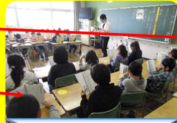
礼儀を意識した授業