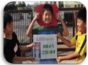
運営委員：あいさつ集会